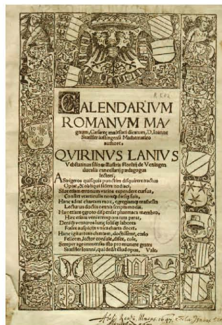
1. Almanach de Stoeffler du début du XVI e siècle.

La jeune femme se «tape» donc tous les centres hospitaliers de la région, en particulier les services de réanimation et les morgues des instituts médico-légaux. Elle recense ainsi environ 17000 cas de suicides et tentatives de suicide couvrant