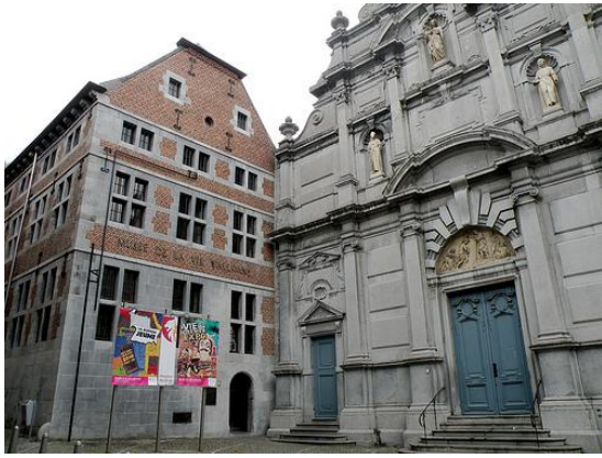
Le Musée de la Vie Wallonne de Liège (à gauche) possède une belle collection d'outils provenant d'ateliers du village des Hauts-Plateaux.

Les jouets les plus intéressants étaient souvent ceux que nous fabriquions nous-mêmes. Les ateliers assez bien équipés des différentes maisons, ainsi que les deux forges du village permettaient bien des prouesses. L'outil le plus indispensable – inséparable compagnon! – était le gros canif sans lequel rien n'était possible. Aujourd'hui, il est devenu une arme prohibée! À l'époque, aucun d'entre nous n'aurait songé à l'utiliser contre un semblable: les différents se réglèrent à force de noms d'oiseaux et, si c'était vraiment nécessaire, par une bonne bagarre qui vidait les rancœurs et tonifiait les muscles! Parfois, il fallait savoir courir vite ou disparaître sans laisser de trace comme dans les meilleurs westerns ou films d'espionnage.