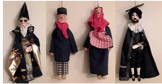
Un théâtre de marionnettes fut pendant des années le point de ralliement d'une bande de gamins du village des Hauts-Plateaux.

Peut-on imaginer aujourd'hui tous les murs de toutes les villes de toute une région couverts de "Z" encerclés suite à l'introduction du fameux personnage de Zorclub par Franquin 3 ? Sans oublier cette zorglangue qui inversait les mots (mais non, pas ce banal verlan) et en laquelle de nombreux discours furent tenus?